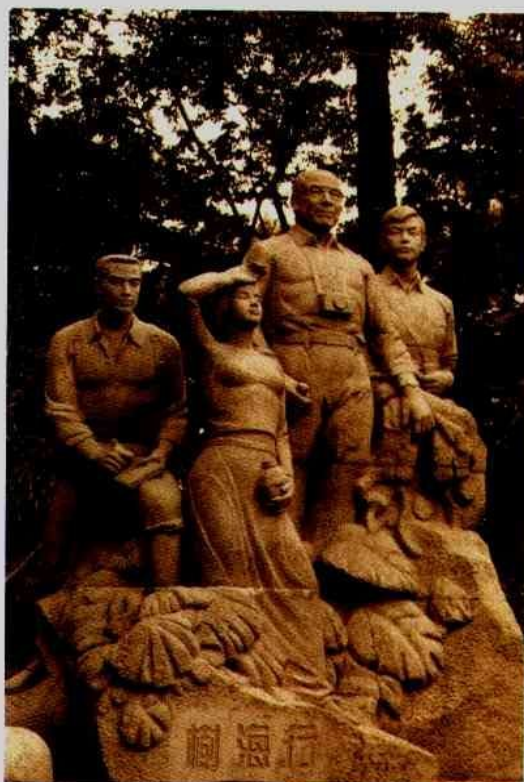
矗立在西双版纳热带资源标本馆门口的雕塑

新中国刚刚成立，边境尚不安宁，蔡希陶与秦仁昌、冯国楣等植物学家一起冒着生命危险，赴德宏、盈江、文山等处寻找橡胶宜林地。1958年，中国科学院昆明植物研究所成立，时任副所长的蔡希陶除了积极参与扩建地处亚热带的昆明植物园和新建地处滇西北的丽江高山